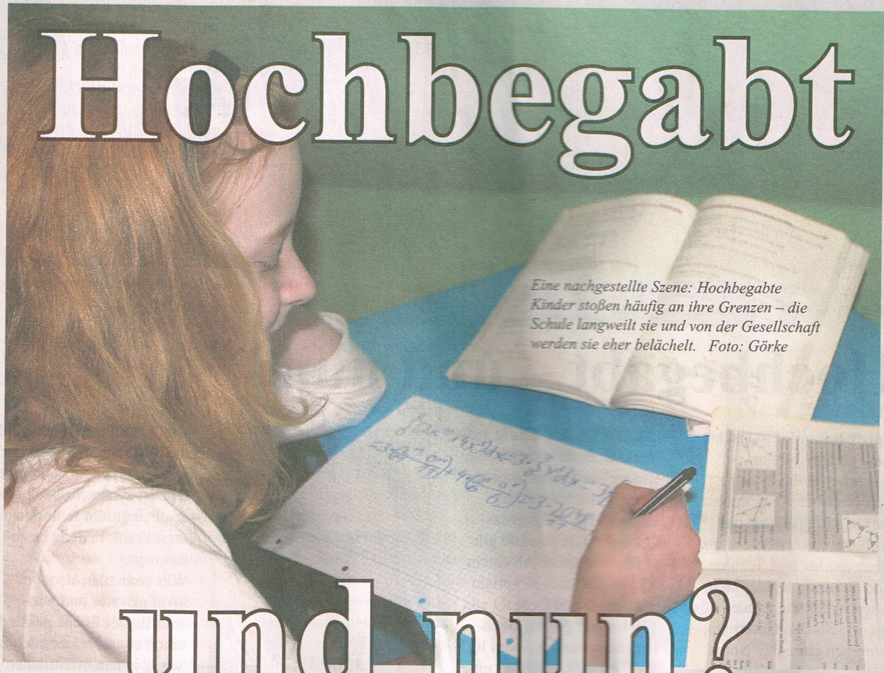
Eine nachgestellte Szene: Hochbegabte Kinder stoßen häufig an ihre Grenzen – die Schule langweilt sie und von der Gesellschaft werden sie eher belächelt.